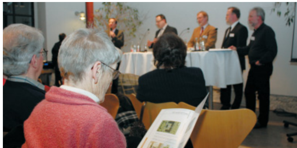
Erste Interessenten: Rund 100 Menschen informierten sich bereits auf einer Informationsveranstaltung in der Ravensberger Spinnerei über das „City-Quartier im Ravensberger Park“.

Hädrich und Köhler haben auf dem Baugelände ein Gerüst aufstellen lassen, von dem aus man die Maße des Gebäudes sehen kann. Interessenten werden gebeten, sich an das Architektenbüro oder die Sparkasse Bielefeld zu wenden. Hädrich rechnet damit, dass das Gebäude Ostern 2010 bezugsfertig sein wird.