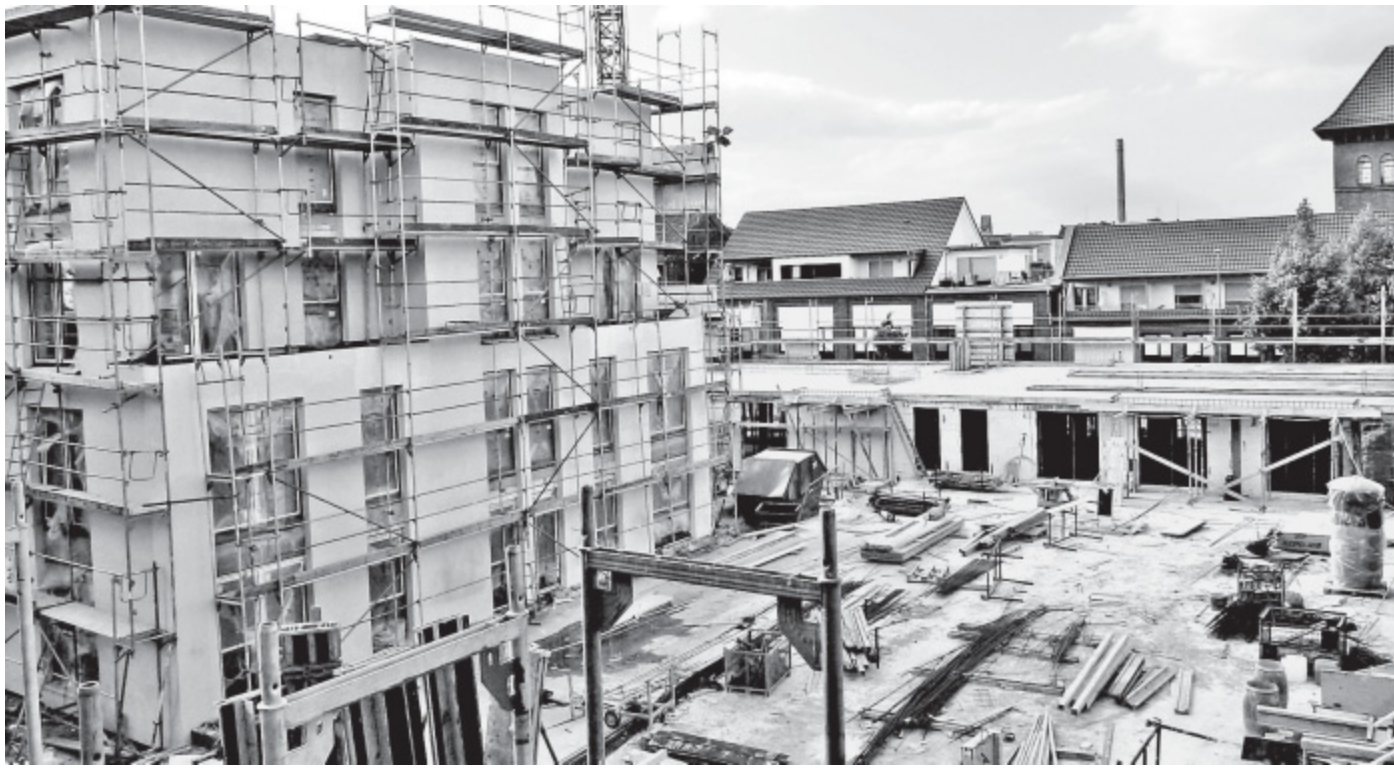
Fast fertig: Das frei stehende Gebäude der Wohnanlage soll bald übergeben werden. Im Erdgeschoss der rechts dahinter stehenden Gebäude direkt an der Werner-Bock-Straße sind Gewerberäume geplant.

Künftige Eigentümer der Gewerberäume im Cityquartier können die Aufteilung mitbestimmen