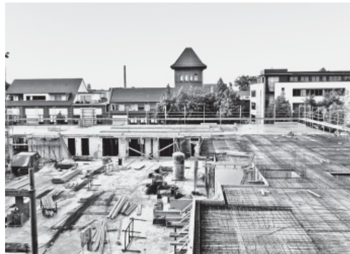
Es geht voran: Stockwerk für Stockwerk wachsen die Gebäude des Cityquartiers. Im Hintergrund ist das Denkwerk zu sehen.