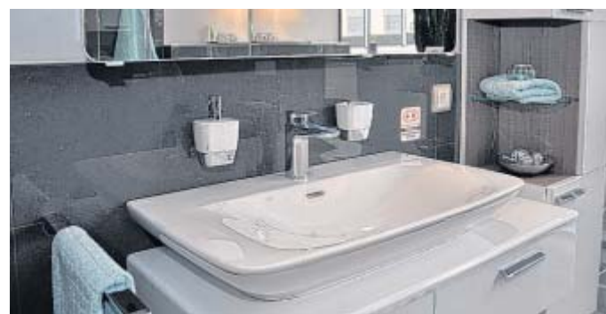
Viel weiß: Die neue Serie „White“ vom Hersteller „Vigour“ setzt auf abgerundete Elemente und ein einheitliches Erscheinungsbild.

Ausstellung und Fachvorträge: Meisterbetriebe informieren Kunden über den Weg von der Ideensammlung zum neuen Bad. In den Ausstellungsräumen von „Elements“ in Bielefelds werden die neuesten Trends und Themen für die Zukunft angesprochen